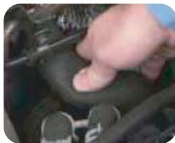
Compruebe todos los manguitos