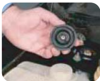
Compruebe el tapón por si tuviera desgaste