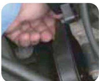
Compruebe el desgaste y la tensión de las correas