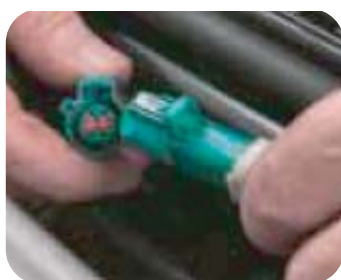
Compruebe todas las conexiones eléctricas

• Llene el sistema de refrigeración con líquido refrigerante. Asegúrese de utilizar un anticongelante recomendado por el fabricante, ya que un anticongelante inadecuado podría dañar el sistema de refrigeración o el motor, o no proporcionar el nivel adecuado de protección. Asegúrese de purgar el aire de todo el sistema de refrigeración.